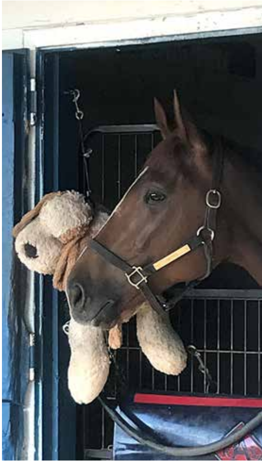
UNITED (Giant's Causeway - Indy Punch)